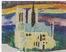
武藤挺一「2018年6月のノートルダム」

ギャラリー杉野 TEL.03 (3561) 1316 中央区銀座1-5-15 高橋ビル1F