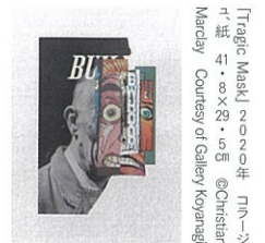
「Tragic Masu」2020年 木版画 41・60×37・45cm @Christian Marclay

ギャラリー小柳 TEL.03 (3561) 1896 中央区銀座1-7-5 小柳ビル9F