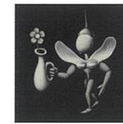
「日曜日のカエデさん」2020年メゾチント 30×30cm ed.30

TomuraLee TEL.03 (6264) 2536 中央区銀座3-9-4 第一文成ビル603