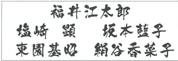
展覧会イメージカット