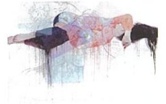
「A Girl With A Past 2」2021年 銀箔、岩絵具、アクリル、和紙コラー、墨肌麻紙 97.0×145.5cm

コバヤシ画廊 TEL.03 (3561) 0515 中央区銀座3-8-12 ヤマトビルB1