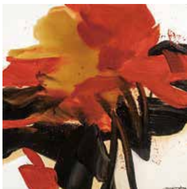
チェン・ジャン・ホン《碎蓮》 80 × 80cm

パブロ・ピカソ／ピエール＝オーギュスト・ルノワール／ベルナルド・ビュッフェ マルク・シャガール／藤田嗣治