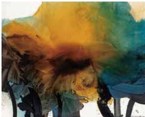
チェン・ジャン・ホン《翠蓮》 130 × 162cm