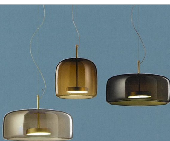
Vistosi / LUMINABELLA Tokyo