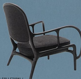
CECCOTTI COLLEZIONI / Cassina ixc.

ORIGINAL FURNITURE / FURNITURE & ITEM / ANTIQUE / CUSTOM ORDER FURNITURE / EXTERIOR / KITCHEN / ART / SANITARY / BED / MATERIAL & ACCESSORY / FABRIC & WALL COVERING / RUG & CARPET / LIGHTING / HEATING / HOME BUILD & REFORM / AUDIO & VISUAL