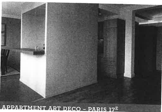
APPARTMENT ART DECO - PARIS 17 E

POUR FAIRE PARAÎTRE UNE ANNONCE DANS LA RUBRIQUE AD IMMOBILIER, MERCI D'APPELER LE 01 44 88 36 29.