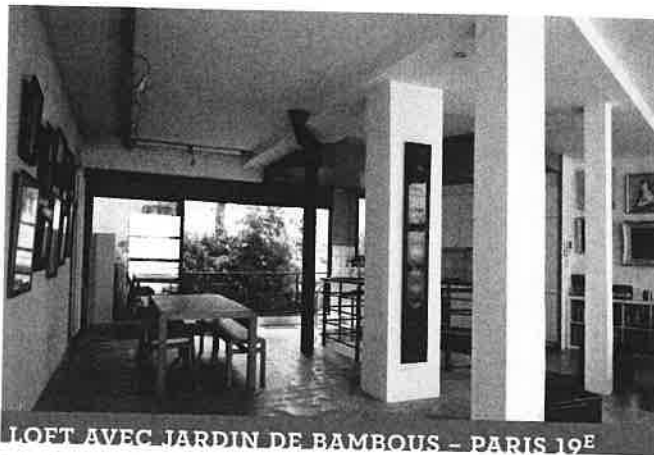
LOFT AVEC JARDIN DE BAMBOUS - PARIS 19 E

Cet appartement de 108 m 2 en étage élevé a été intégralement restructuré à la façon d'un loft tout en préservant l'esprit d'origine, notamment les moulures. Des blocs colorés ont été créés afin d'abriter les pièces techniques. La pièce à vivre est bordée d'un balcon, cuisine ouverte, deux chambres, salle de bains, salle d'eau. Possibilité 3 e chambre. Porte de Champerret, Classe énergie en cours. Prix : 995 000 euros