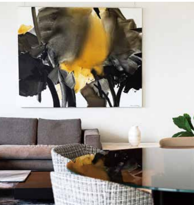
チャン・ジャン・ホン CHEN Jiang Hong