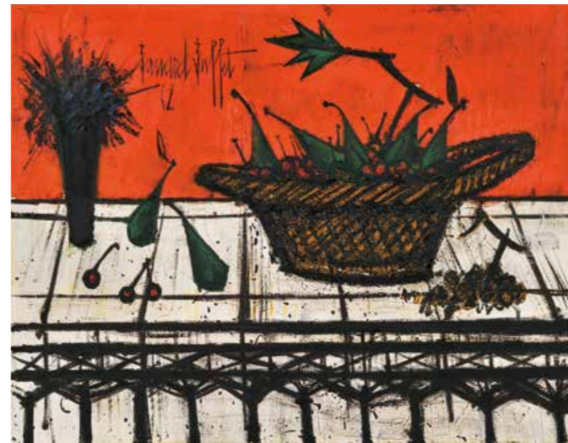
ベルナール・ビュッフェ Bernard Buffet