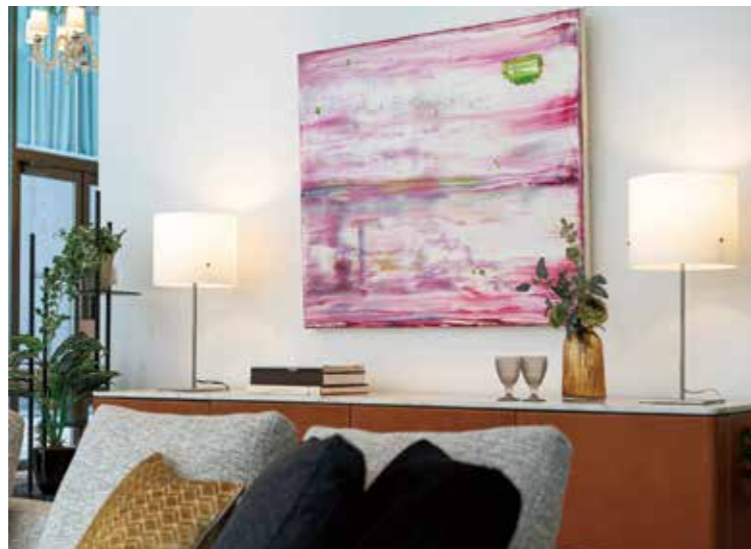
吉川 民仁 Tamihito YOSHIKAWA