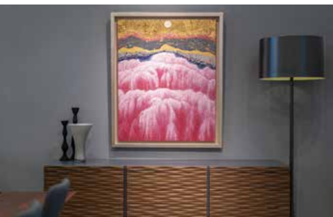
智内 兄助 Kyosuke TCHINAI