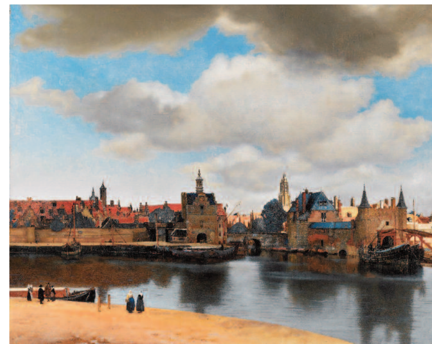
Vue de Delft, Johannes Vermeer, 1659-1660 (96,5 cm x 115,5 cm).