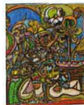
Marc Duran, Le plongeur et le port de fleurs , 2016 Topolino (Marc Combas), Rue Villaret , 2016