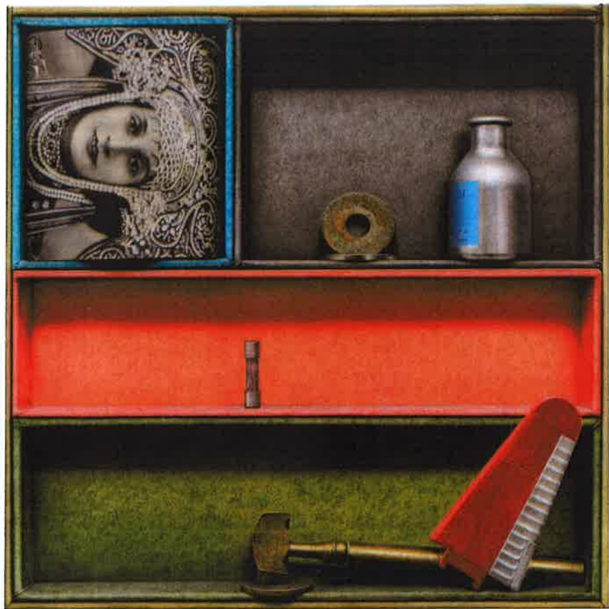
Dos Virtudes – Huile et acrylique sur panneau – 135 x 135 cm

Vernissage le 17 novembre, à partir de 18h En présence de l'artiste