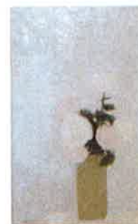
Bernard Cathelin, Boisquet de roses au Japon , 1972, huile sur toile, 92 x 60 cm

Art impressionniste moderne et contemporain