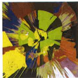
Damien Hirst, Sem-ekul-painting , 2012, acrylique sur cirebande, 100 x 100 cm