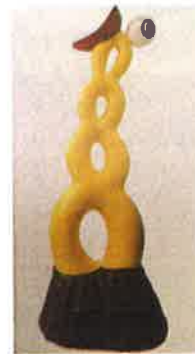
Buddy (Richard di Rosa), Déesse à la lune , 2016