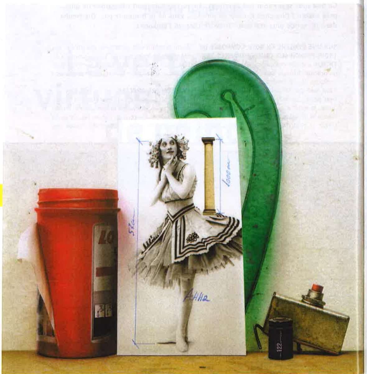
Lorenzo Fernandez, Fortaleza , huile et acrylique sur bois, 95 x 95 cm