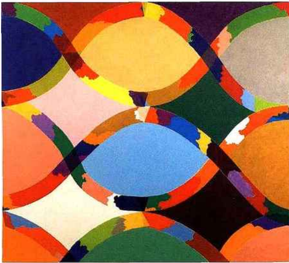
PIERO DORAZIO, Ideal II , 1968, huile sur toile, 150 x 170 cm, galerie Tornabuoni.