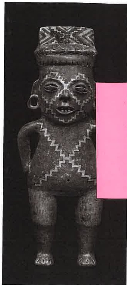
Mexique 400 - 200 av. J.-C., Déesse debout, Chupicuaro, Guanajuato, Michoacan. Terre cuite, 38,5 x 15,5 x 8 cm.