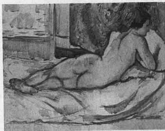
HENRI MANGUIN (1874-1949)