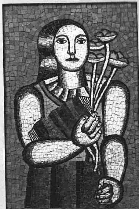
F. LEGER Mosaïque "Femme au bouquet" (100 x 65 cm)

19, avenue Matignon - 75008 Paris Tél. : 01 53 96 95 85 - Fax : 01 53 96 95 94 makassar-france@wanadoo.fr - www.makassar-france.com