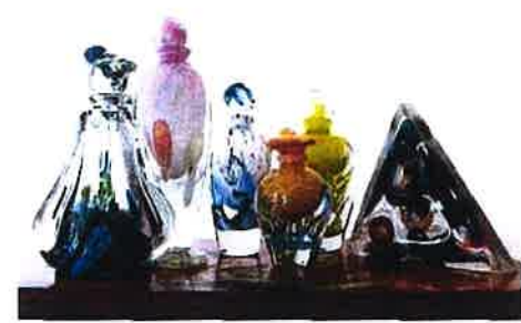
AUX PUCES SAINT LOUIS A VERSAILLES DE GAUCHE À DROITE : FLACON CRISTAL SCUTTLE UGAN CLAUDIC MORAWKA / FLACON ROSÉ TRANSLUCIDE BLEU JAUNE FLEUR ORANGE ISABELLE MONOD ET VERRE GRAND TOURBILLON (YAMAURA) CO. RITES D'ART FINE YAMAURA VERSAILLES