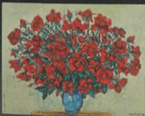
アンドレ・コタボ「赤いバラのブーケ」(114×146cm)