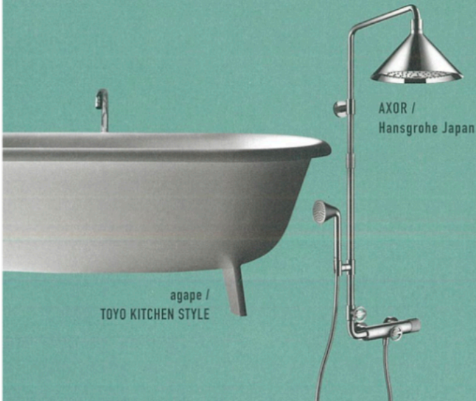
agape / TOYO KITCHEN STYLE