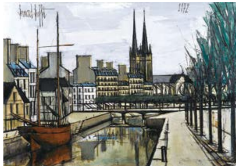
ベルナール・ビュッフェ Bernard BUFFET