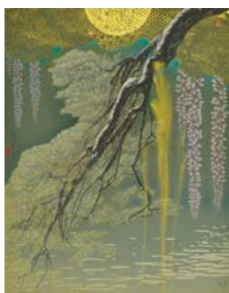
智内 兄助 Kyosuke TCHINAI