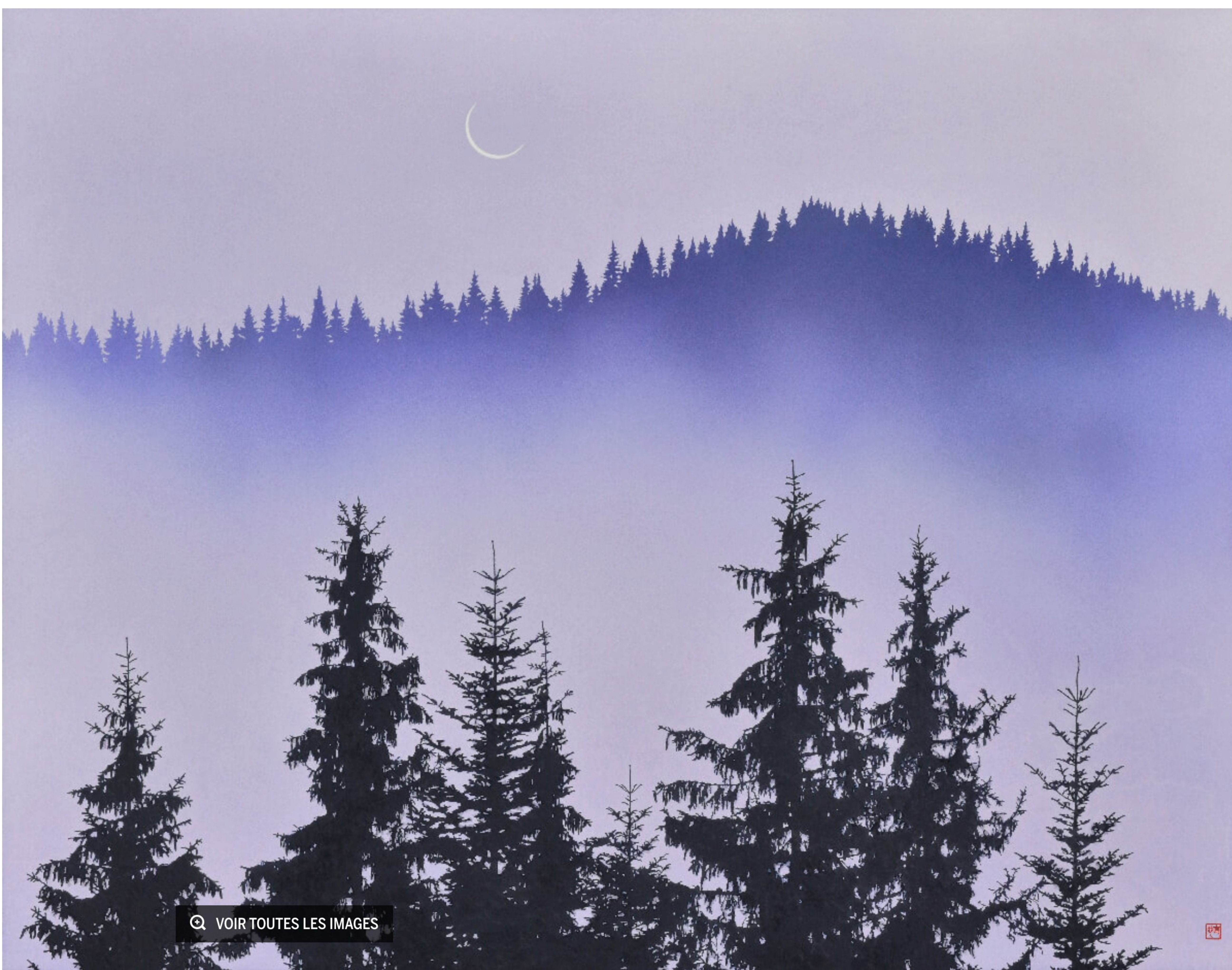
Naoya Egawa, Ascension du brouillard

Par Millys Celeux-Larval • le 3 octobre 2023 à 16h10