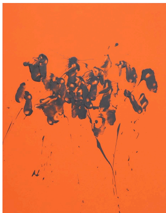
「knock 2026 #V×GS11」90×70cm

Ses principales expositions personnelles incluent « Hone Intuition » (JD Malat Gallery, Dubaï, 2026) et « Rest in Silver » (JD Malat Gallery, Londres, 2024). Ses expositions collectives récentes incluent ART FAIR TOKYO (2024, 2025) et « New Kyoto IMA KYOTO » (Galerie Taménaga Kyoto, 2025).