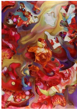
「What Remains Unnamed」 215×152cm