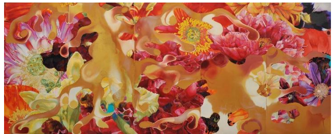
「Flower Undulation」 200×500cm