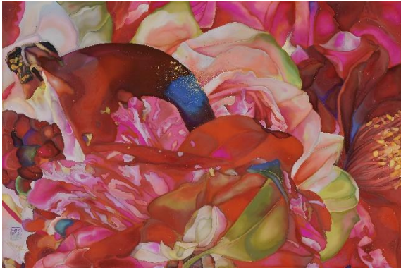
「Undivided Flow #1」 61×91 cm