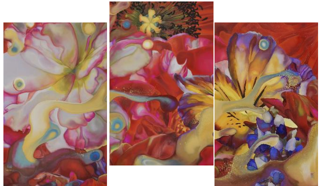
「In Flow (triptyque)」 91×61cm