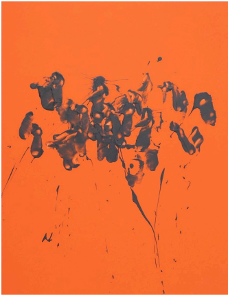
「knock 2026 #V×GS11」 90×70cm