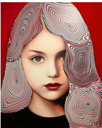
【Jane Doe】 162×130cm

「FACE2020 損保ジャパン日本興亜美術賞展」入選。近年の主なグループ展に「新京都 IMA KYOTO」(ギャラリーためなが京都、2025)、「桜満載 Merry Cherry Blossom」(ギャラリーためなが京都、2026)など。