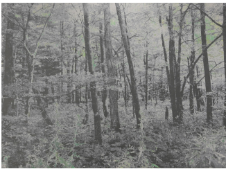
「Mirage #113」 110×150cm

主な個展に「Hone Intuition」(JD Malat Gallery、ドバイ、2026)、「Rest in Silver」(JD Malat Gallery、ロンドン、2024)など。近年の主なグループ展に「ART FAIR TOKYO」(2024、2025)、「新京都 IMA KYOTO」(ギャラリーためなが京都、2025)など。